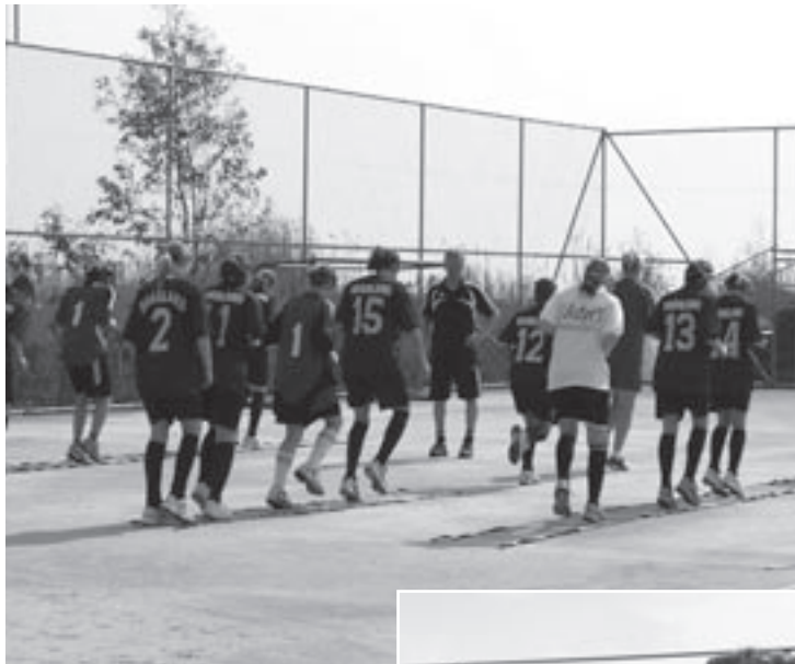
Koordinationsübungen sind wichtig