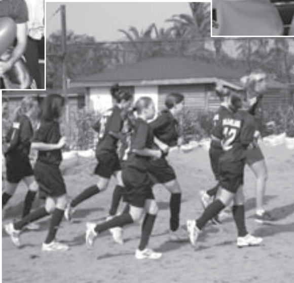
Vor dem Frühstück stand ein Strandlauf auf dem Programm