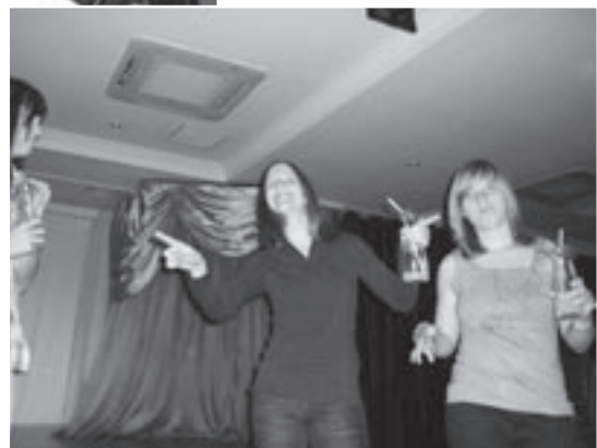
Disco-Abend nach anstrengendem Training