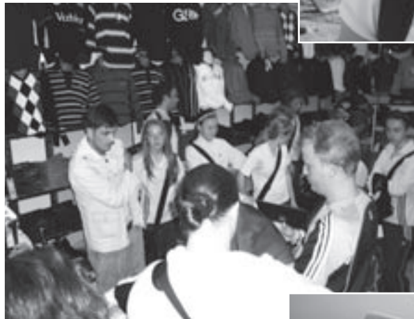
Man merkt: Eine Mädchenauswahl geht gerne shoppen