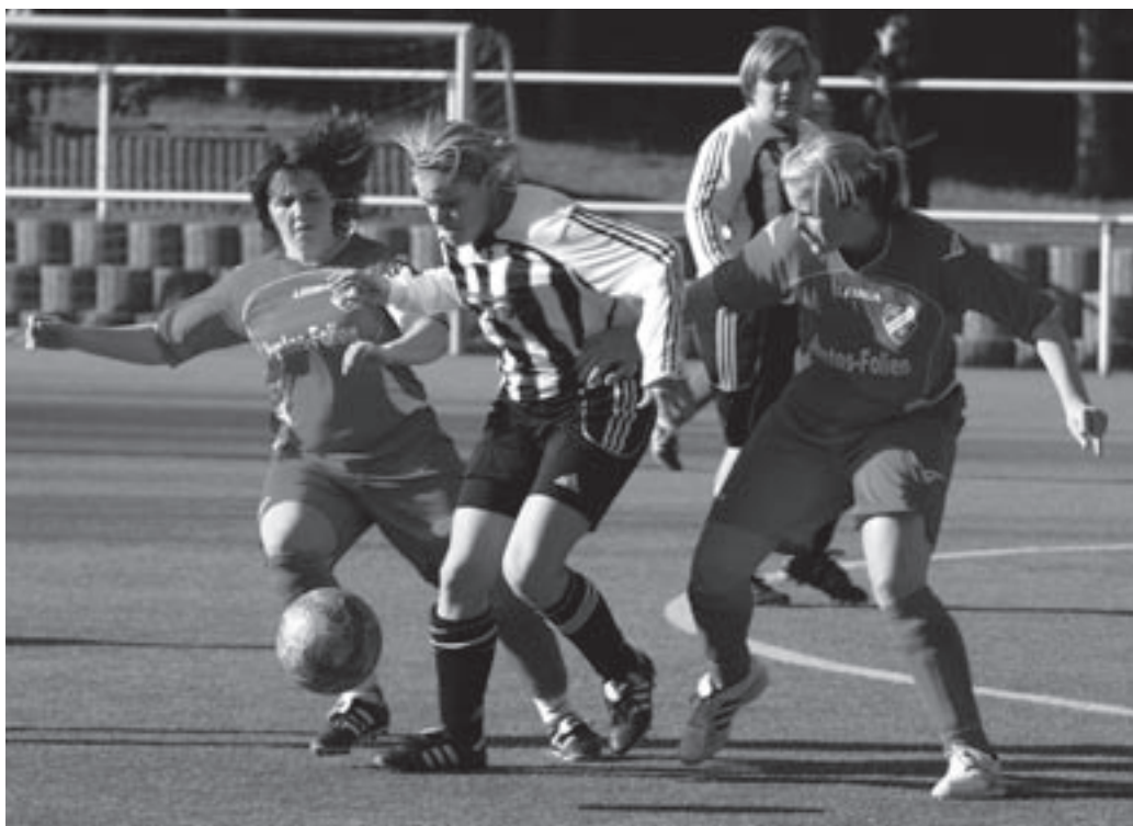
rassiger Dreikampf im Spiel gegen Mitlosheim